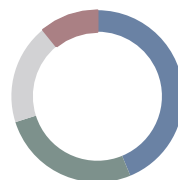
Distribución Renta Fija

27,88% Corporativo 16,81% Gobierno 12,07% High Yield 6,97% Emergentes