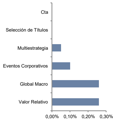
Principales estrategias y gestoras subdelegadas del fondo principal