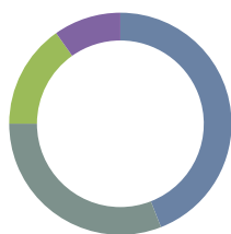
Estrategias: peso en cartera y aportación a la rentabilidad de los activos fondo principal