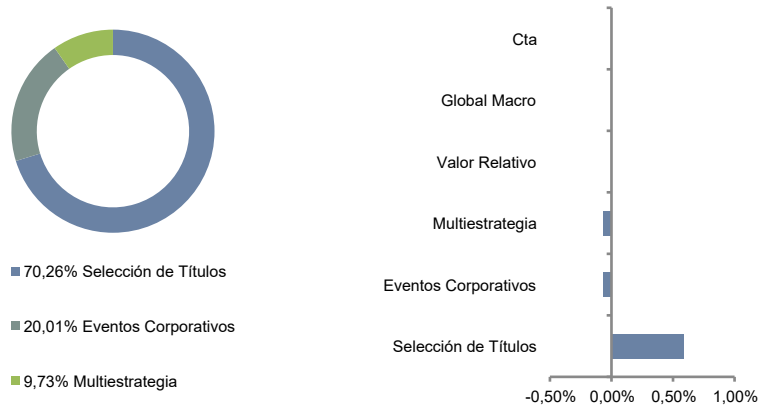
Principales estrategias y gestoras subdelegadas del fondo principal