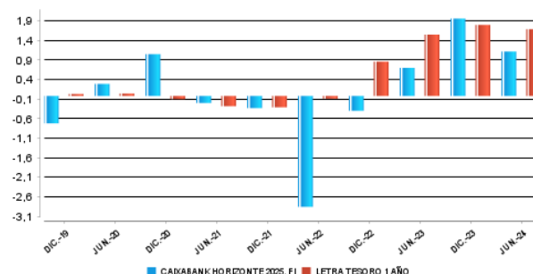
Gráfico rentabilidad semestral de los últimos 5 años